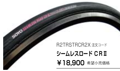
R2TRSTRCR2X 注文コード シームレスロード CR II ¥18,900 希望小売価格

・縫い目のないシームレス技術による丸い断面がリムへの装着性を高め、軽量でしなやかな仕上がりが、抜群の加速を生むと共に、グリップ性能を一段と向上させます。 ・カラー：オールブラック・用途：ロードレース用 ・仕様：700 C チューブラー シームレス・サイズ：22.0mm・チューブ：国産ラテックス・バルブ仕様：仏式・適正気圧：700-900KPa (7-9Bar)・重量：220g・バルブ長さ：36mm