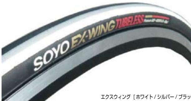
エクスイング [ホワイト/シルバー/ブラック]