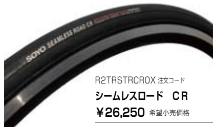
R2TRSTRCROX 注文コード シームレスロード CR ¥26,250 希望小売価格