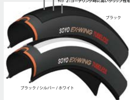
ブラック/シルバー/ホワイト

センタートレッド：転がり抵抗が低く、耐摩耗性に優れたハードラバー サイド1：グリップ性と耐摩耗性を両立するミディアムラバー サイド2：コーナリング時に高いグリップ性を発揮するソフトラバー