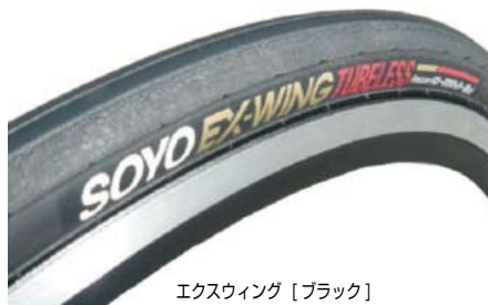
エクスイング [ブラック]