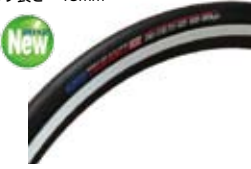
R2TRTUAPOLX 注文コード トゥルーアンスプラス ¥6,615 希望小売価格

・ドライ路面でのロードタイヤ、競技練習用タイヤとして最適。 ・カラー：オールブラック・用途：ロードトレーニング ドライ路面用・仕様：700 C チューブラー・サイズ：22.0mm・チューブ：ブチル・バルブ仕様：仏式・適正気圧：700-900KPa (7-9Bar)・重量：290g・バルブ長さ：42mm