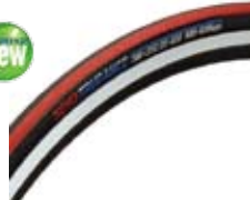
R2TRTUA00RX 注文コード トゥルーアンス ¥3,675 希望小売価格

・カラー：ブラック・用途：ロードレース用・仕様：700C クリンチャー・デュアルコンパウンドを採用センターに転がり抵抗の小さいゴム、外側に高いグリップ力のゴムを使用・高いグリップ力を発揮するスリックパターン・転がり抵抗を抑えた軽い走りとコーナーでの優れたグリップ性能を備えたレーシングモデル・120TPI ケーシングを採用することにより超軽量化・シルクワーム構造(蚕の繭のようにタイヤ全面をシールド)とケブラーレーカーを採用することによりパンクリスクを大幅に軽減・重量：205g