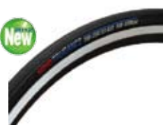
R2TRTUA00LX 注文コード トゥルーアンス ¥3,675 希望小売価格

・カラー：レッド・用途：ロードレース用・仕様：700C クリンチャー・デュアルコンパウンドを採用センターに転がり抵抗の小さいゴム、外側に高いグリップ力のゴムを使用・濡れた路面でも優れたグリップ性能を発揮するミックスパターン・60TPI ケーシングを採用し、トレーニング・ロングライドに最適・シルクワーム構造を採用することにより、パンクリスクを軽減・重量：220g